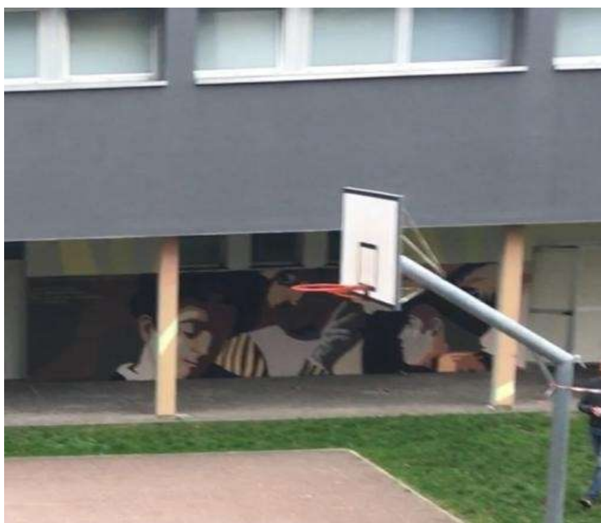
CORTILE con campo da basket